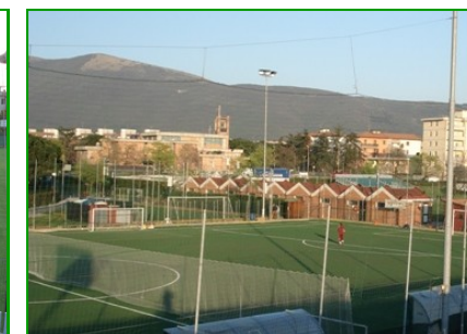
Stadio comunale - Via Caduti Senza Croce, Maliseti - Prato (PO) - Tel. 0574.650675 - Fax. 0574.655249