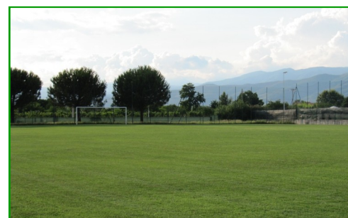
Impianto sportivo "Mons. Danilo Aiazzi": Via Traversa Vicinale 37/a, Tobbiana - Prato (PO) Tel./fax: 0574.662203